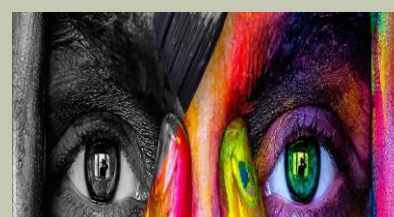
GRAFICA E DISIGN