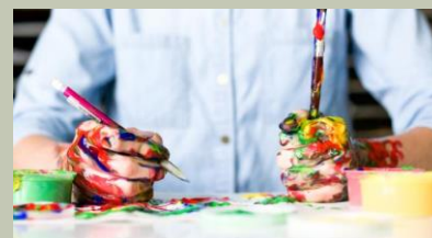
ARTE E SPETTACOLO