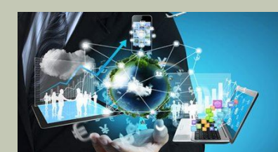
INFORMATICA E TELECOMUNICAZIONI. IA