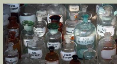
CHIMICA E FARMACEUTICA